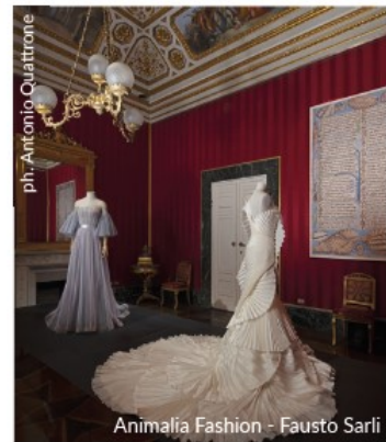
Animalia Fashion - Fausto Sarli

Ferragamo and the world of cinema, with the most famous directors and stars of the '30s. The room dedicated to Salvatore Ferragamo closes the itinerary, where the shop that was opened in Hollywood in 1923 is faithfully rebuilt.