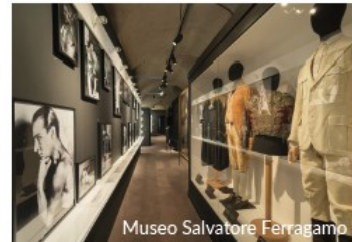
Museo Salvatore Ferragamo